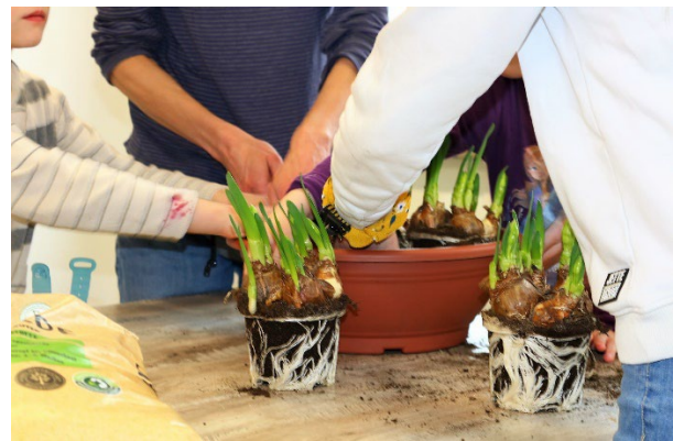
Kreatives Osterfrühstück in den Räumen des MOBILE e.V. in Dortmund.