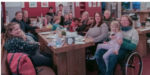
Erfahrungsaustausch im Mütterzentrum Dortmund.

Unter dem Titel „Mit Elternassistenz Familie leben – Ein Erfahrungsaustausch für Eltern mit Behinderung“ trafen sich Anfang November Eltern, die bereits Elternassistenz nutzten, und solche, die sich zu dem Thema informieren wollten, zum Erfahrungsaustausch im Mütterzentrum Dortmund. Eingeladen dazu hatte das Kompetenzzentrum Selbstbestimmt Leben (KSL) für den Regierungsbezirk Arnsberg in